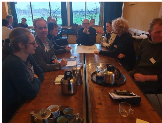
*tafel 1 beleid - beheerplan - beheerkaart