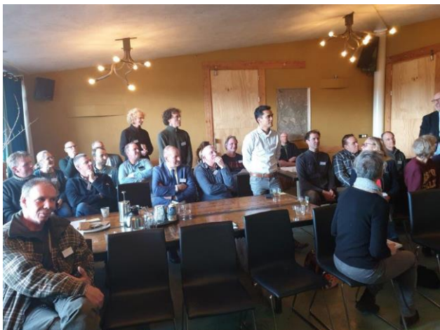
*plenair gedeelte - introductie