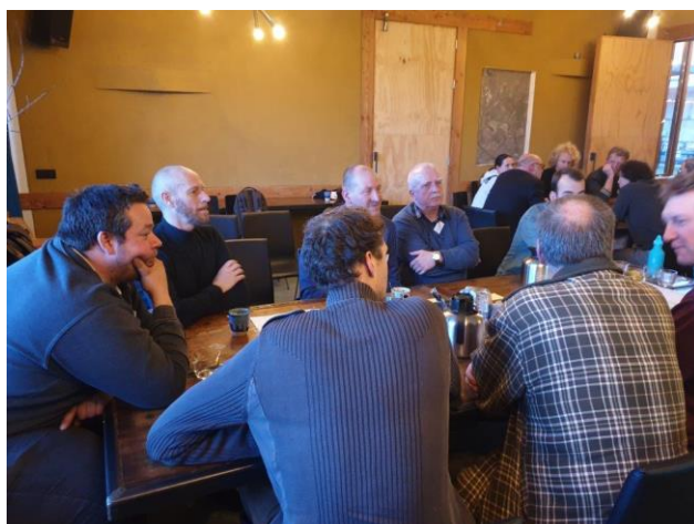
*tafel 3 bestek - onderhoud - monitoring