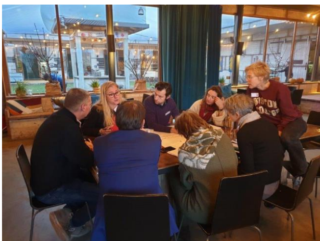
*tafel 2 aanbesteding - inschrijving – beheer