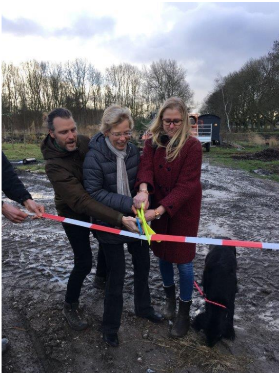
*opening collectieve composteerlocatie

Hieronder volgt een beknopt verslag, zie ook de bijbehorende diapresentaties en tuinenvanwest.info .